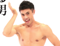
2006年 教育学部卒業 小島よしお お笑い芸人

自分が2留してまさにこの状況だったこと 『君の名は。』という最近の人気作品をあえて入れたことで 時代が特定できて素晴らしい!