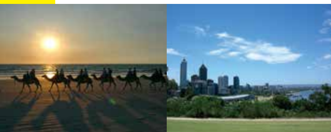
1.インド洋の前にラクダ乗り 2.パース

主人の定年後、1999年からパースに住んで16回目のクリスマス、お正月を迎えました。1992年に心筋梗塞になった主人の「定年後はストレスのない所で、毎日ゴルフをして過ごしたい」という希望に沿って、カナダ、ハワイ、オーストラリアなど移住地を検討した結果、安全で時差がなく生活費の安いパースになりました。