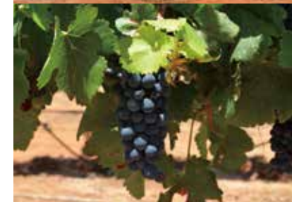
ワイナリー巡りが楽しめる