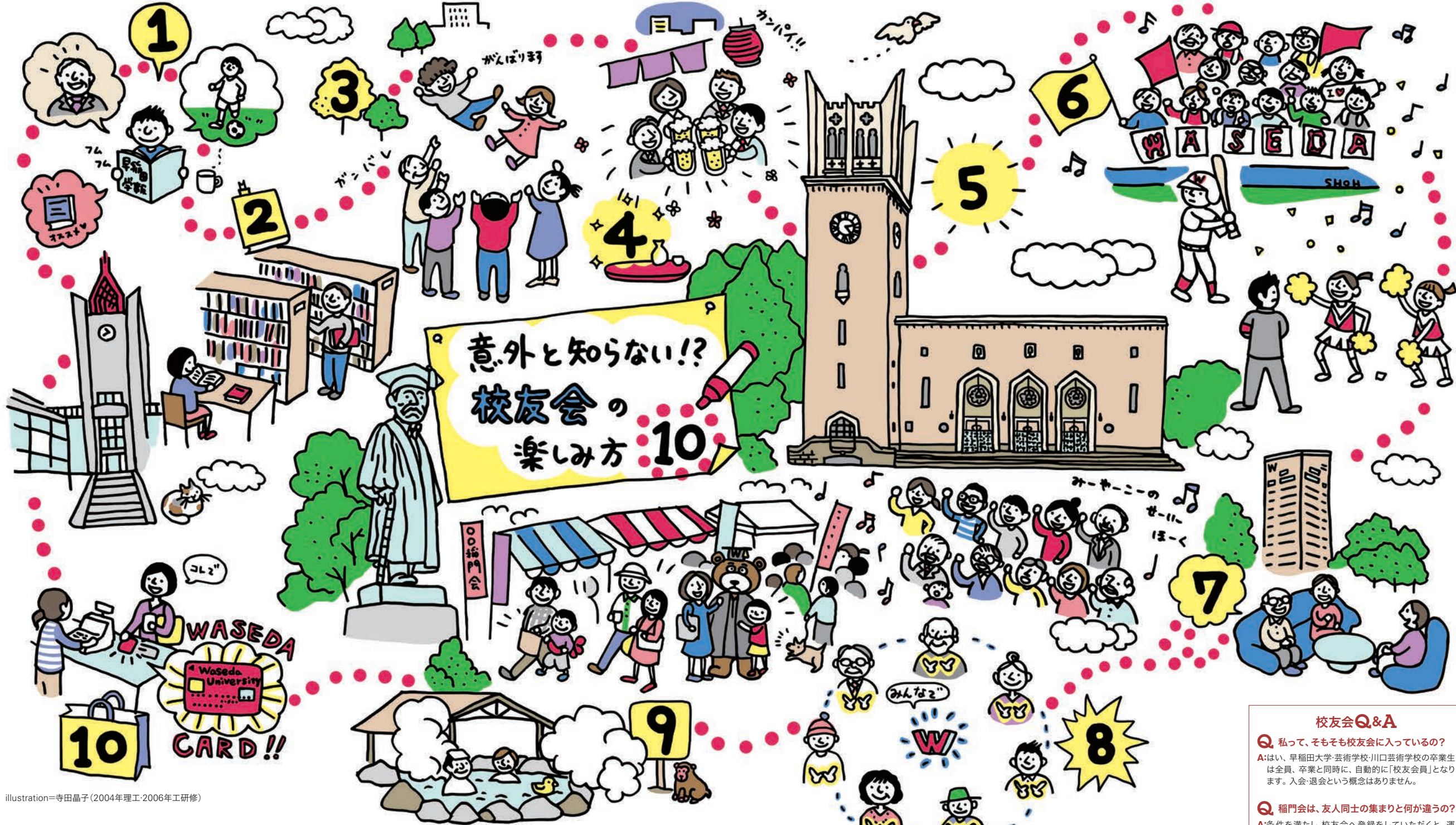
illustration＝寺田晶子 (2004年理工・2006年工修修)

◆ご郵送いただく際は、個人情報が隠れるように保護シールを貼付の上、投函してください。