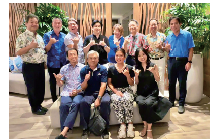
留学中の現役学生や短期滞在者の参加が多いのもハワイ稲門会の特徴だ

創立は1975年。来年2025年に50周年を迎えます。現在、会員数は約50人。1963年卒業の大先輩から現役学生まで幅広く在籍しています。駐在員より現地で起業するなど自分の意思で移住した会員が多く、平均の在住年数が長いのがハワイ稲門会の特徴。40年以上続くハワイ東京六大学ゴルフ大会への参加や、ハワイ三田会など他大学同窓会との連携もあります。ヨット試乗会やホノルルマラソンの応援などハワイらしいイベントも盛りだくさんですよ！